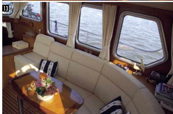
7 Ingang naar de salon. 8 De trui die roet in het eten gooide... 9 Brede gangboorden. 10 Modder in het wierfilter. 11 Buiten sturen. 12 Kombuis. 13 Zitbank in de salon.